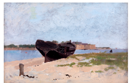
Elodie La Villette, Barques devant la citadelle Huile sur toile, s.d., collection particulière