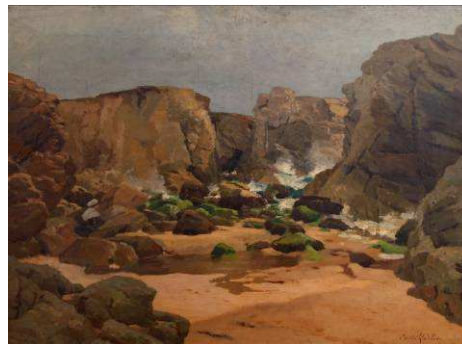
Elodie La Villette, Port-Bara , huile sur toile, s.d., collection particulière

Face à l'avant-garde installée, les tableaux des deux sœurs passent de mode. Deux destins de peintres, dans une actualité mouvementée, où, entre Corot et Kandinsky, l'avant-garde, mène de l'impressionnisme à l'abstraction en passant par le fauvisme et le cubisme. L'une refuse énergiquement cette modernité et reste obstinément fidèle à la tradition. L'autre y participe un peu, discrètement et très probablement en solitaire. Elodie La Villette et Caroline Espinet nous offrent un bel exemple de la complexité de l'histoire de la peinture, trop souvent réduite aux prestations de l'avant-garde.