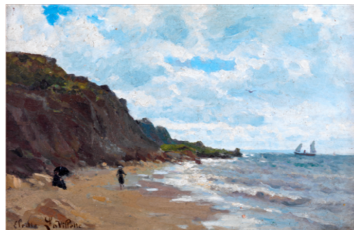
Elodie La Villette, Jeune fille jouant sur la plage , huile sur toile, s.d., collection particulière

Elodie La Villette ne se passe qu'exceptionnellement du détail humain : voile ou vapeur très lointains, canot bravant la tempête, ou improbable observateur téméraire.