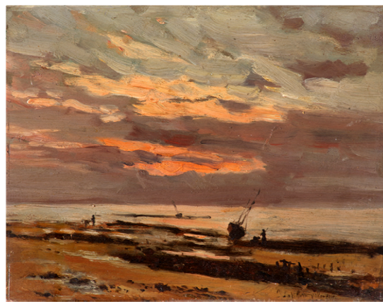
Elodie La Villette, Marée basse au crépuscule , huile sur bois, s.d., collection particulière

Avant 1880 les femmes étudient principalement dans les ateliers privés, bien souvent les maîtres qu'elles choisissent sont des anciens Prix de Rome. Dans le dernier quart du siècle, les deux ateliers les plus côtés sont l'Académie Colarossi et l'Académie Julian.