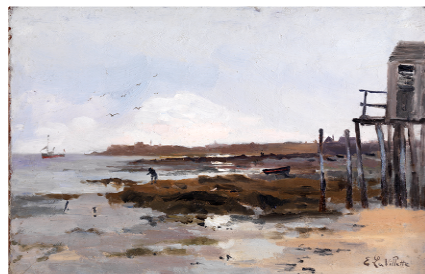
Elodie La Villette, La cabane du pêcheur Huile sur toile, s.d., collection particulière

L'exercice pictural se libère, elle pose les couleurs en grands ensembles, les nuances peu à peu, les coups de brosse restent visibles, la matière s'enrichit, travaillées en légères touches qui appuient la couleur. Le dessin et le souci descriptif sont délaissés pour la virtuosité picturale. Dans ces petits formats, le paysage s'affirme pleinement dans sa complétude, mer et ciel, eau et lumière. Les effets lumineux, trop mis en scène dans les grands tableaux, deviennent l'intérêt majeur, scrutés au plus près.