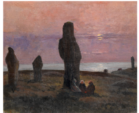
Caroline Espinet, Crépuscule, les menhirs de Kerbougne , huile sur toile, s.d., collection particulière

Les femmes artistes vont devoir se battre pour changer les choses et se faire accepter : en 1881, sous l'impulsion d'Hélène Bertaux (1825-1909) qui en est la fondatrice, est créée une Union des femmes peintres et sculpteurs qui va organiser ses propres Salons. Elodie La Villette est vice-présidente et Virginie Demont-Breton (1859-1935) est élue présidente.