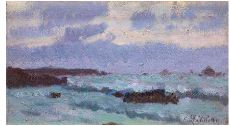
Elodie La Villette, pochade de crépuscule marin . Elodie La Villette, La pointe de Beg-an-Aud, Portivy huiles sur toile, s.d., collections particulières

Quel que soit le temps, chaque jour, jusqu'à un âge très avancé, elle s'installait toute emmitouflée, pour peindre non loin de chez elle à Portivy.