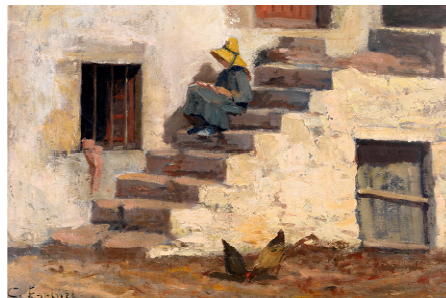
Caroline Espinet, Jeune Bretonne assise sur l'escalier , huile sur toile, s.d., collection particulière

Musée de Morlaix Place des Jacobins 29600 Morlaix 02 98 88 68 88 (accueil) 02 98 88 07 75 (conservation) museedemorlaix@villemorlaix.org www.musee.ville.morlaix.fr